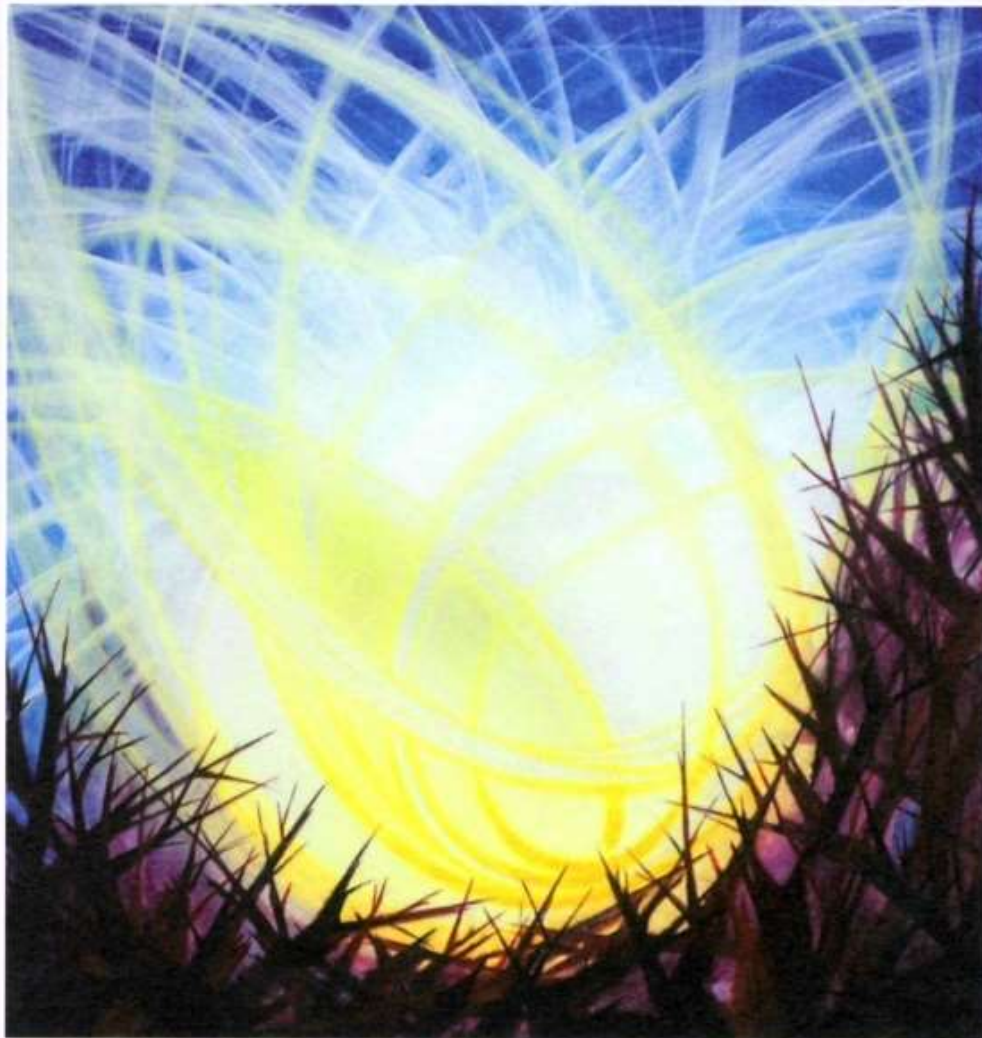
Durch das Leid zur Freude © Sr. Regina Lehmann

„Durch das Leid zur Freude“ lautet die Überschrift des Titelbildes von Schwester Regina Lehmann. Es ist ein sehr treffendes Bild für die Heiligen Tage rund um Ostern. Ohne das Leid ist der Jubel von Ostern nicht denkbar – ohne das herrliche Ostern wäre alles Leid der Welt hoffnungslos!